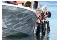
奥尻ブルーカーボン体験