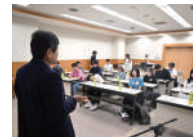
ビジネスプラングランプリを目指せ!