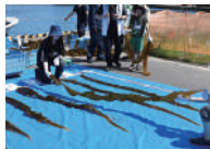
海藻と環境セミナー