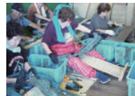
昆虫の危機を救えプロジェクト