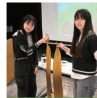
海藻ねばねば体験